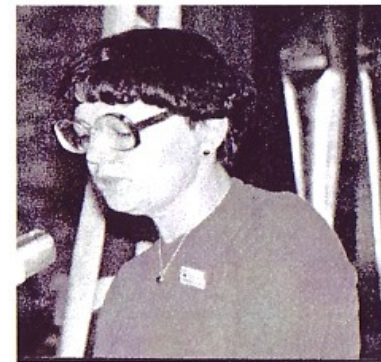
(Hedwig vor 1978)

Mitgliedern, davon 684 im Kinder- und Jugendbereich, der drittgrößte Sportverein im Saarland und der größte im Saarländischen Turnerbund.